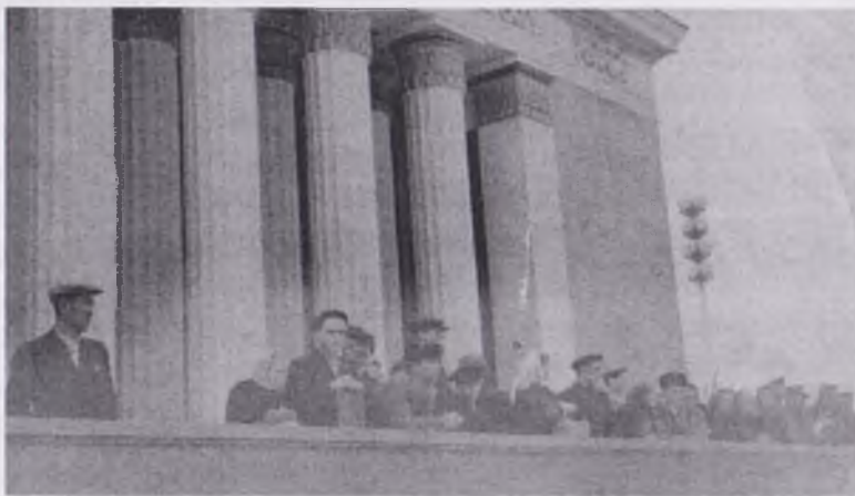
Москва. ВДНХ. 1956 г.